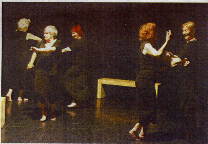
"בכלל לא נורא להיות זקנה, לפעמים זה אפילו יפה". בנות המופע "גילה" בפעולה