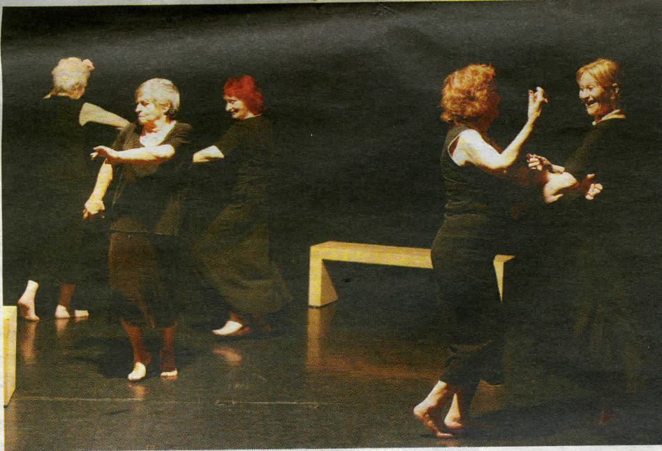
"בכלל לא נורא להיות זקנה, לפעמים זה אפילו יפה". בנות המופע "גילה" בפעולה

בן-ישראל גדלה בבית בורגני בתל-אביב, וכמו נערה בת-טורבים באותה תקופה נרשמה לחוג מחול אצל גרטרוד קראוס. "ואז העלו באופרה העממית את 'הלנה היפה', והחליטו על חידוש מהפכני לאותו זמן - להכניס קטע בלט בתוך האופרה. גרטרוד התבקשה להביא את הלהקה שלה, ואני חזרתי הביתה מאושרת וסיפרתי להורי שארקוד על במה. אבא שלי אמר: 'אני יודע מה